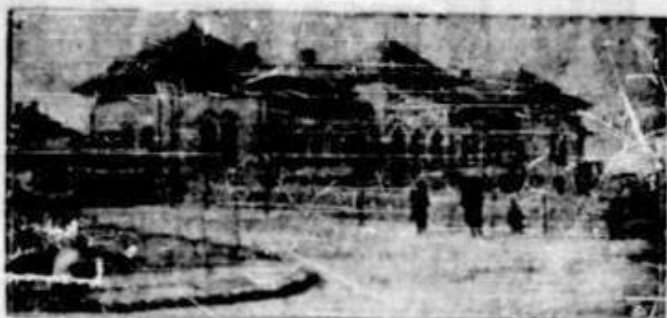
Școala St. Gheorghe